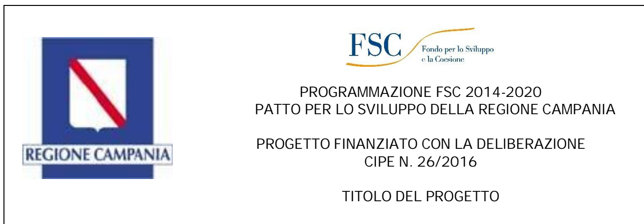
Figura 2. Esempio di spazio informativo